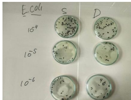
Gambar 1. Hasil analisis TPC

Didapatkan hasil bahwa jumlah bakteri yang didapatkan pada sampel ialah 5.55x10 -3 . Hasil yang didapatkan lebih rendah dibandingkan dengan standar yang tertera pada SNI 2014, yaitu 1 x 10 -5 cfu/g. Dari hasil tersebut didapatkan bahwa nilai bakteri yang terkandung masih dalam batas ambang normal SNI. Total Plate Count (TPC) pada produk pangan sangat penting karena sangat terkait dengan keamanan produk pangan untuk dikonsumsi dan tingkat kerusakan produk. Adanya kontaminan mikroba yang muncul selama proses pembuatan bakso yang berasal bahan baku yang ditambahkan. Metode pengolahan maupun tempat pengolahan dapat terkontaminasi oleh bakteri [9] Sedangkan hasil didapatkan bahwa pada pengamatan setelah 48 jam nilai bakteri meningkat. Hal ini menunjukkan bahwa bakteri akan terus berkembang biak di suhu 35°C.