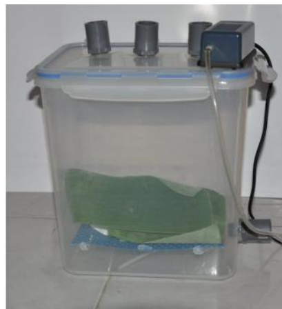
Gambar 2. Alat Fermentasi