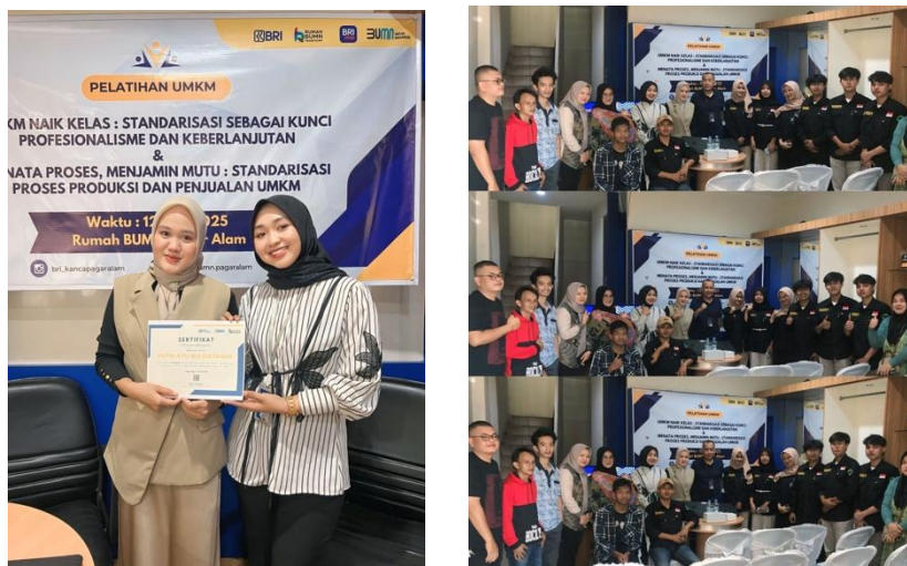
Gambar 2. Kegiatan Pelatihan

Kegiatan pelatihan Pengabdian kepada Masyarakat telah diselenggarakan di Rumah BUMN Kota Pagaram pada tanggal yang telah ditetapkan. Peserta kegiatan terdiri atas pelaku UMKM Kota Pagaram yang didampingi oleh mahasiswa Institut Teknologi Pagaram (ITPA). Kegiatan Pengabdian kepada Masyarakat dibuka secara resmi oleh perwakilan pengelola Rumah BUMN Kota Pagaram. Rangkaian kegiatan pelatihan meliputi pemberian materi terkait standardisasi UMKM, penyusunan prosedur operasional baku (SOP), dan pengenalan dasar HACCP, dilanjutkan dengan pendampingan, penugasan akhir, serta simulasi penerapan materi oleh peserta sesuai dengan jenis usaha masing-masing.