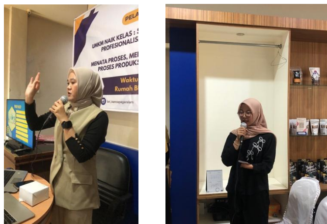
Gambar 4. Simulasi Kegiatan

Grafik batang menunjukkan bahwa sebagian besar peserta pelatihan telah menggunakan internet dalam kegiatan usaha (85%), namun hanya sebagian kecil peserta yang telah mengenal dan menerapkan standardisasi usaha (20%) dan hanya sebagian kecil pelaku usaha juga yang membukukan SOP usaha (20%). Hal ini mengindikasikan perlunya pelatihan yang berfokus pada peningkatan pemahaman dan penerapan standardisasi sebagai dasar penguatan profesionalisme dan keberlanjutan UMKM.