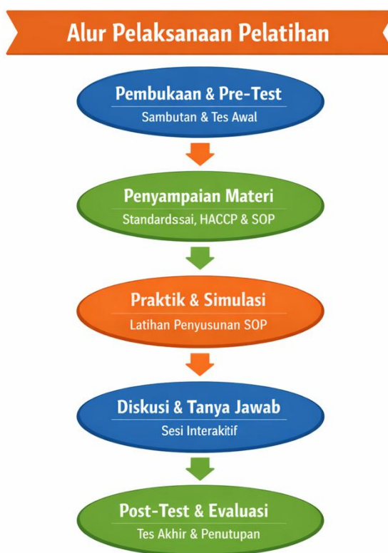
Gambar 1. Alur Pelaksanaan Pelatihan

Tahapan pelatihan dilaksanakan di Rumah BUMN Kota Pagaram dengan melibatkan pelaku UMKM dan mahasiswa Institut Teknologi Pagar Alam (ITPA). Kegiatan meliputi pembukaan dan pre-test, penyampaian materi standarisasi UMKM, SOP, dan dasar HACCP, dilanjutkan dengan praktik penyusunan SOP, diskusi dan tanya jawab, serta diakhiri dengan post-test dan evaluasi kegiatan.