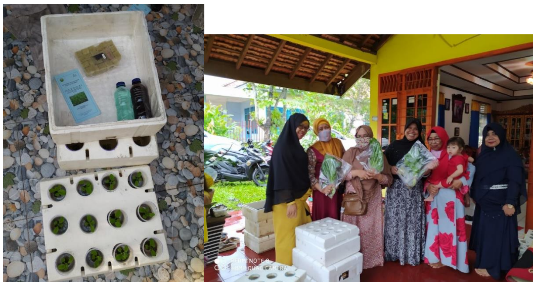
Gambar 3. Paket kit hidroponik dan pemberian paket hidroponik

Setelah dilakukannya demonstrasi dan pelatihan maka tim pengabdian masyarakat menyerahkan paket hidroponik kepada Ibu-ibu PKK Kelurahan Sukabangun, yaitu berupa paket kit hidroponik sederhana dan buku petunjuk untuk menanam hidroponik sederhana serta sayuran sawi dan pakcoy hidroponik.