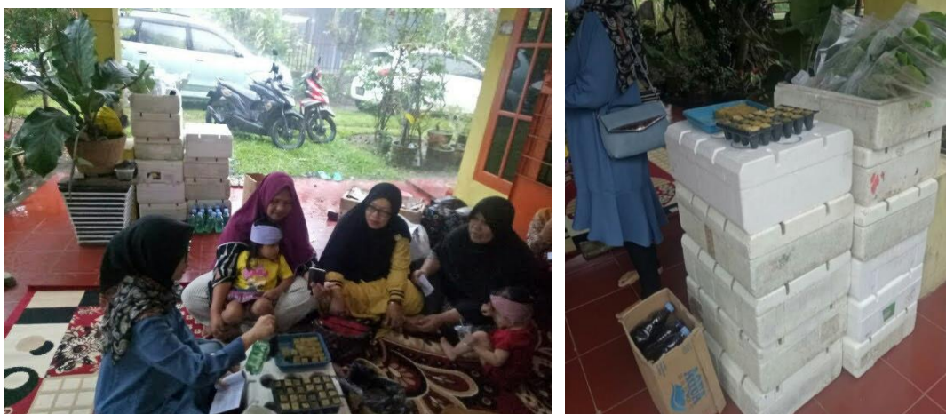
Gambar 1. Ceramah tentang system hidroponik