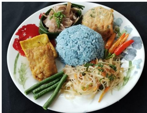
Gambar 5. Nasi khas Desa Argowisata