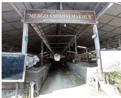
Gambar 2. Sapi center

Berikut adalah beberapa bukti dokumentasi hasil produk unggulan dan potensial yang dimiliki Desa Agrowisata.