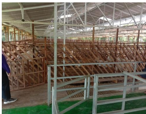
Gambar 4. Kambing etawa center