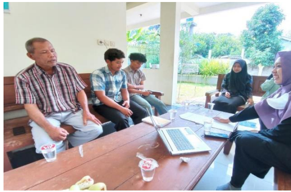
Gambar 7. Pelatihan dan pendampingan tim abdimas dan warga Desa Argowisata

Sementara itu, gambaran Dashboard pengelolaan kas yang terdiri dari sheet pencatatan pemasukan, pengeluaran, kasbon PIC, Laporan Kas, Laba/Rugi, Neraca seperti yang ditunjukkan pada Gambar 8.