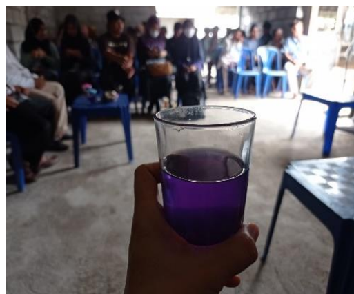
Gambar 3. Teh bunga telang