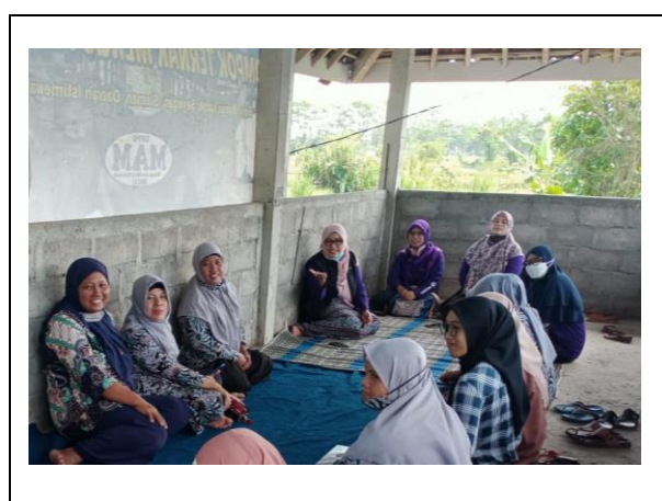
Gambar 6. Dokumentasi wawancara tim abdimas dan warga Desa Argowisata

Berdasarkan temuan tersebut, dapat diketahui bahwa pengelolaan keuangan Desa Agrowisata Bolu masih membutuhkan perbaikan dan pengembangan. Oleh karena itu, diperlukan adanya implementasi Manajemen Kas yang lebih terstruktur dan efisien dalam mengatur pengajuan pengeluaran dan pencatatan penerimaan yang terkait dengan kegiatan agrowisata. Dengan adanya sistem Manajemen Kas yang tepat, diharapkan akan tercipta proses pengelolaan keuangan yang lebih terukur, transparan, dan akurat, sehingga dapat meningkatkan efisiensi pengelolaan dana dan membantu mencegah potensi kesalahan perhitungan.